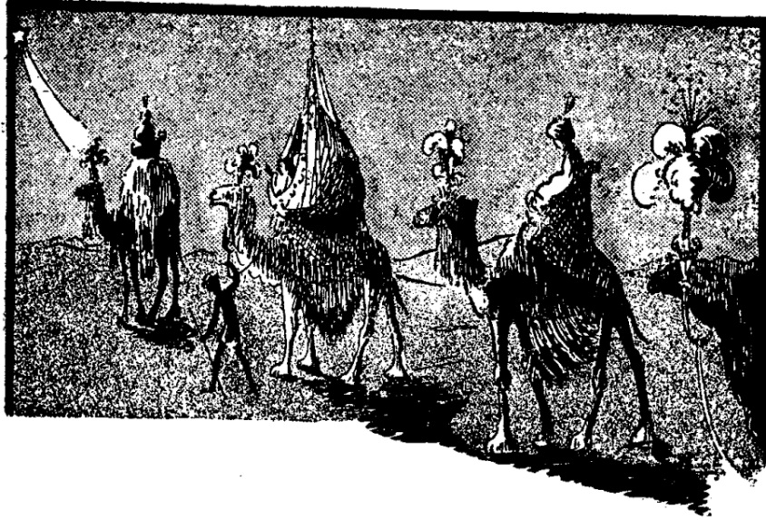
La caravane du riche Melchior Sadi.

« Pour le Roi nouveau-né, mes plus précieux trésors ! murmura-t-il, je n'ai rien de plus beau ni de plus cher que ma perle rose, mon Azula ! »